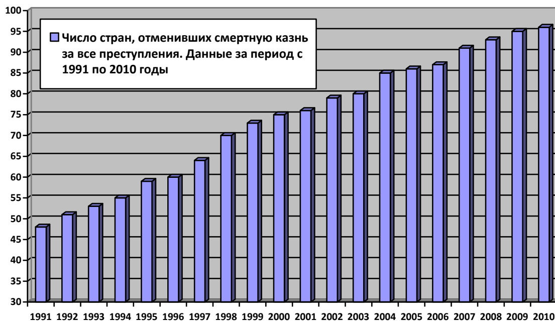
Рис. 2. Число стран, отменивших смертную казнь за все преступления. Данные за период с 1991 по 2010 годы.

Рисунок 2 наглядно показывает, что за период с 1991 года по 2010 год число стран, отменивших смертную казнь за все преступления, возросло ровно в два раза. Если в 1991 году их было 48, то в 2010 году – 96.