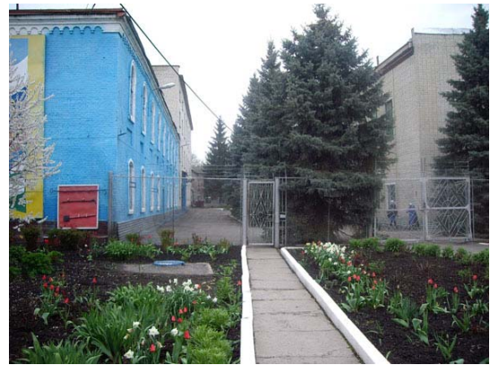
Вход в Новооскольскую колонию для девочек, г. Новый Оскол