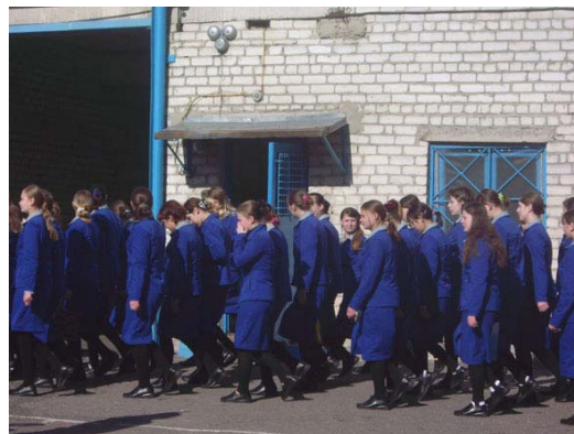
Передвижение по территории колонии строем.

Подготовка к жизни на свободе, как принято говорить, начинается с первого дня девушки в заключении. Сначала собирается вся информация, проводится диагностика, затем психологи, воспитатели, инспектора по социальной работе проводят индивидуальные и групповые беседы, занятия, тренинги. Если возможно подтвердить гражданство, помогают оформить паспорт. Выясняют наличие жилья и жилищные условия, перспективы устройства на работу. Для выяснения разнообразных проблем осужденных, колонии приходится посылать запросы в удаленные регионы, ведь девочки, отбывающие наказание в Новом Осколе Белгородской области, прибывают туда из 39 регионов России. Трудности связи и взаимодействия, отсутствие государственной системы постпенитенциарной адап-