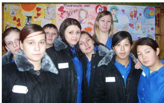
Творческий конкурс «Мама».