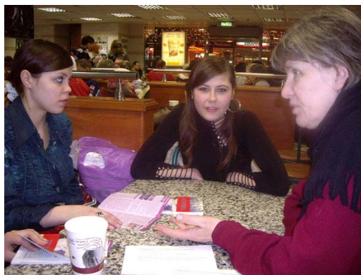
Встречи и сопровождение освободившихся девочек в Москве, едущих в Пермский край. За завтраком в Макдоналдсе обсуждаем планы на дальнейшую жизнь.