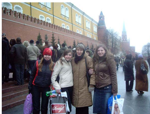
Прогулки по Москве с освободившимися девочками. Красная площадь.