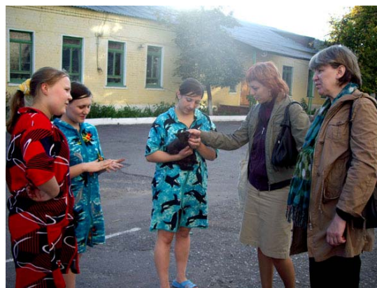
Общение сотрудников Центра «Содействие» с воспитанницами на территории колонии – свободное время.